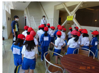
3年生 ハレルヤ 製菓工場