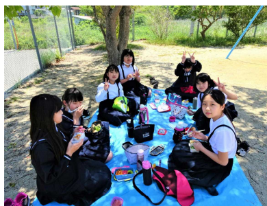
5・6年生は校内の好きな場所でお弁当を食べました。