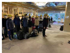
ホテルの方に出発あいさつ