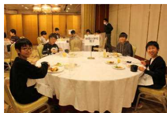
ホテルでの夕食や朝食の様子