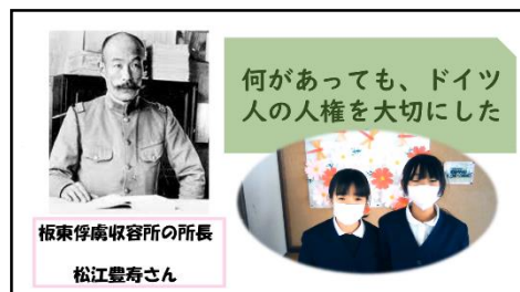
5年生「なると第九学習について」