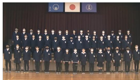
6年生 歌「We are all special」