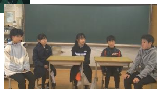
「地域学習を通して」