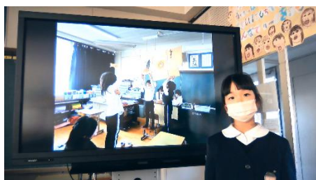
1・2年生 おもちゃランド ～1年生を招待して～

コロナ禍で2年間中止となっていた人権集会。今年度、感染症対策から、各学年の人権学習の取組を動画にまとめ、校内で各学級に配信するという形で実施しました。子どもたちの人権意識の高まりを感じることができました。