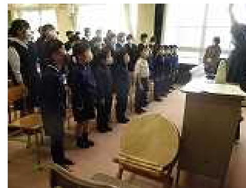
♪ 全校合唱練習風景 ♪