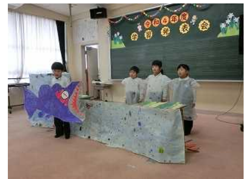
❖学習発表会がんばりました!