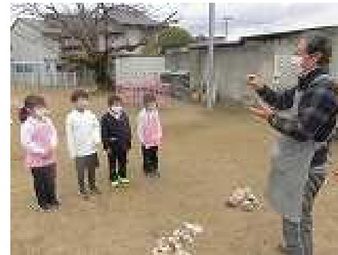
❖初めての楽焼きに挑戦!