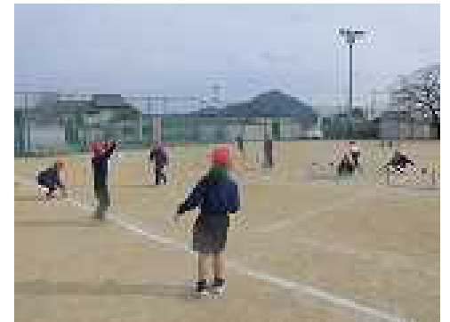
❖寒さに負けず、外でボールゲーム!