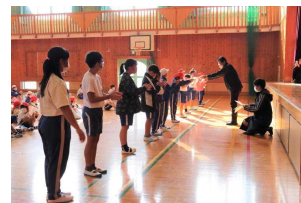
へいかいしき 閉会式