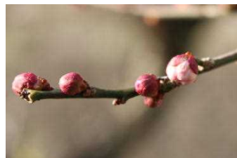
学校の梅のつぼみ

立春を過ぎ、暦の上ではもう春です。まだまだ寒い日が続いていますが、梅の花のつぼみもだんだんとふくらんできました。春はもうすぐそこまで来ているようです。