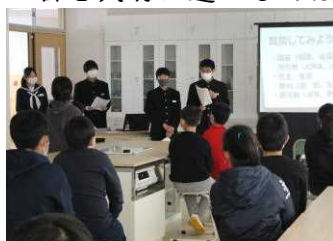
クイズを交えてのガイダンス