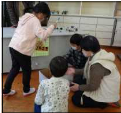
まつぼっくりゲーム

12月20日(火)、学校探検に連れて行ってくれたり、おもちゃ広場に招待してくれたりした2年生に感謝の気持ちを伝えるため、秋祭りに招待し手作りおもちゃで楽しんでもらいました。子どもたちは、おもちゃの遊び方やゲームの仕方を説明したり、2年生が楽しめるようゲームを盛りあげたり、手作りプレゼントを渡したりしました。しっかり2年生に感謝の気持ちを伝えることができました。