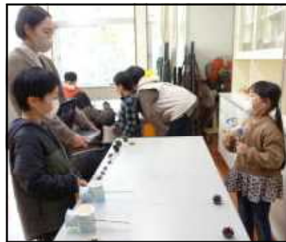
まつぼっくりけんだま