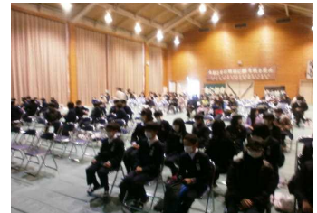
【入学説明会の様子】

新しい環境や那賀川中学校への期待を感じることのできる説明会でした。在校生の皆さんも今一度、あの時の気持ちに立ち返ってみませんか。「初心忘るべからず」です。