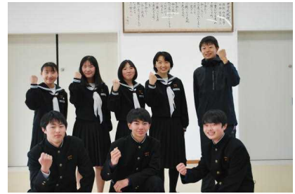
【旧生徒会役員の皆さんお世話になりました】↑

生徒会役員が3年生から2年生へとバトンタッチしました。また、ボランティア活動も2年生へと引き継がれました。どちらも、元気に初々しく頑張っている姿を見せてくれています。これからは2年生が那賀川中学校を支えていくのです。3年生の皆さん、安心して受検に向かってください。1年生の皆さんは2年生の姿をよく見ておいてください。