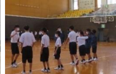
体育祭練習の様子