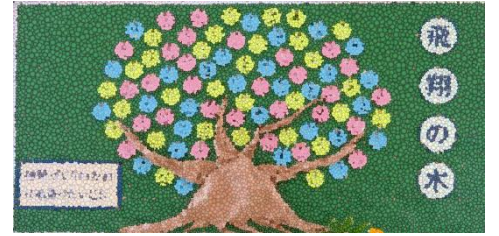
掲示：大切にしたい思い

入学後、1年生全員で、仲間作りで大切にしたい思いを1文字に込めて伝え合いました。それから、およそ9ヶ月が過ぎ、選んだ1文字をもとに今の現状を振り返りました。学年から学校へと仲間が増えたり、新たな目標を見つかったりと、よい人間関係を築くための視野が広がってきました。