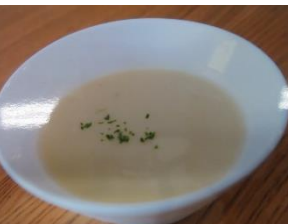
サツマイモポタージュ