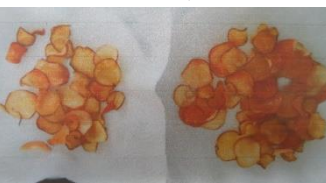
サツマイモチップス

大変だったのは、サツマイモをフォークでつぶすところだ。私が一番好きな味は「みたらし」だ。