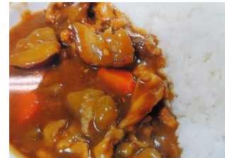
サツマイモカレー