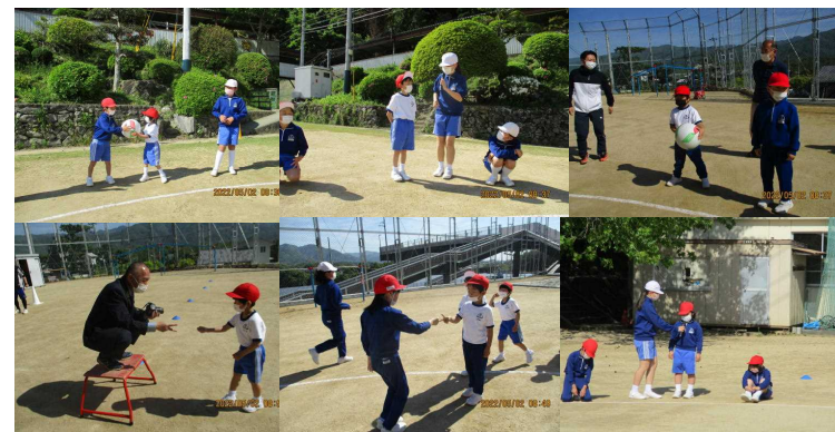
メダルをもらって嬉しかったよ!

5月2日(月) 1年生を迎える会 晴れた空の下、全校で「ばくだんゲーム」「ジャンケンピラミッド」を楽しむことができました。1年生は、全員がオンラインでインタビューを受け、自分の名前や好きなものを話しました。