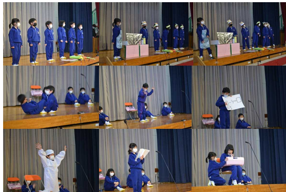
1年生になってできるようになったことを発表しました。頑張る姿がきらきらしていました!