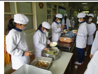
給食準備（密を避けるため、廊下で配膳準備をします）

社会では世界地図について調べました。 地球儀をつかって距離や方角を調べました。 覚えることがたくさんあって、悪戦苦闘しました！！世界の国名も覚えるぞ！