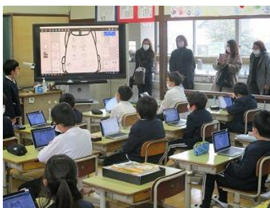
3年生 総合 「ひなんりゅックの中身を考えよう」