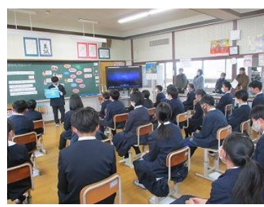
6年生 外国語 「自分の思いを伝えよう」