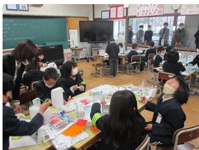
1年生 図工 「たのしいいえをつくろう」

2月10日（金）に今年度最終のPTA授業参観を実施しました。多くの保護者の皆様にお越しいただき、子どもたちも張り切っていました。雨の中での駐車場の誘導や、受付係など、PTA広報研修委員の皆様、三世代交流委員の皆様にはたいへんお世話になりました。ありがとうございました。