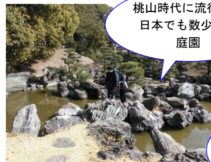
桃山時代に流行した 日本でも数少ない 庭園

6年生と5年生の合同で社会科学習のため、校外学習に行きました。阿波藩のことを学ぶため徳島城博物館へ、メディアのことを学ぶためにNHK徳島放送局へ行きました。昼食は、徳島市役所食堂で市役所職員の方といっしょに、それぞれが食券を買って注文をしました。また、公共交通機関に乗る機会が少ない子どもたちに、ぜひ利用する機会を与えたいと徳バスを利用しました。礼儀正しい入田小の子どもたちはどこに行っても褒められました。大変誇らしい気持ちになりました。