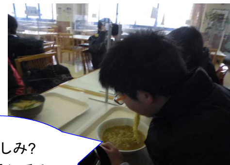
一番楽しみ? だった ランチ!