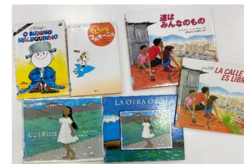
ブラジル、チリ、ベネズエラの絵本と日本語訳の絵本

令和3年6月の図書館だよりにも掲載しましたが、みなさんが「好きな本・置いてほしい本」の中に、次のような回答がありました。色々な興味があること、いいですね。