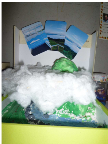
工作「雲海のもけい」

また自由研究は、身の回りにあるものの中から学年に応じて、自分の興味・関心をもとにテーマを決めて、工夫を凝らしながら観察や実験、資料調べなどをしてまとめています。テーマの例を挙げると「鳴門の海から塩を作ってみた」、「読書バリアフリーについて」、「SA・PA（高速道路）のスタンプ発見」などです。それぞれ子どもらしい着眼点で研究をしています。