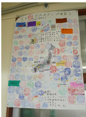
「SA・PAのスタンプ発見」