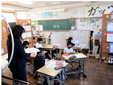
たんぼぼ学級 (国語)