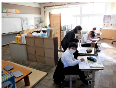
すだち・コスモス学級 (国語)