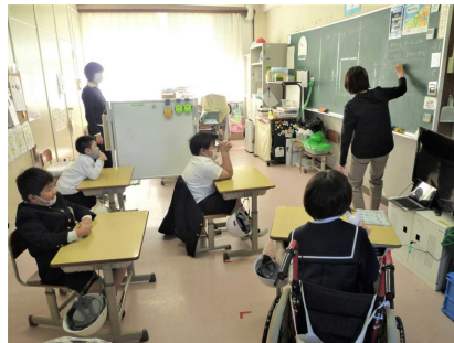
つくし・ひまわり学級 (生活単元)