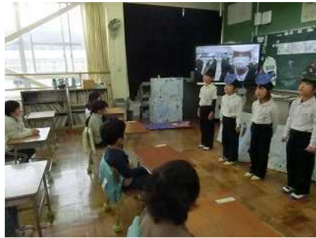
新一年生を招待しました。(体験入学)