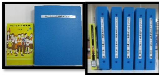
単行本と点字図書の大きさ比較