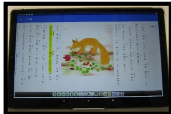
マルチメディアデージー

などを用いて、本文の音声とテキストデータ、挿絵を視聴できるのが、マルチメディアデージーです。デジタル教科書に音声がついていると考えるとわかりやすいと思います。本校へは、タブレット1台がきています。左のように再生される所が黄色のマーカーで示されるなど、視覚的にもわかりやすくなっています。