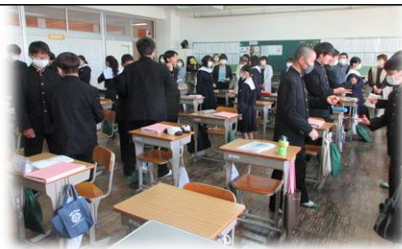
4月22日(土) 授業参観 保護者の皆さま方、ありがとうございました。