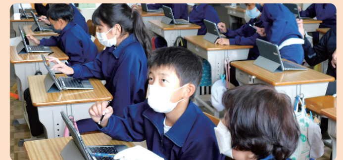
プログラミング学習