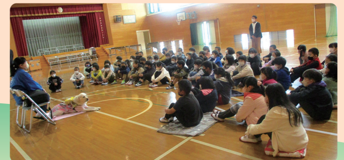
盲導犬ユーザーとの交流