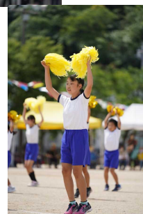
各班 すてきな ダンス