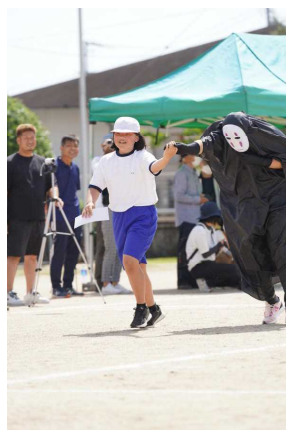
かおなしがこけかけ