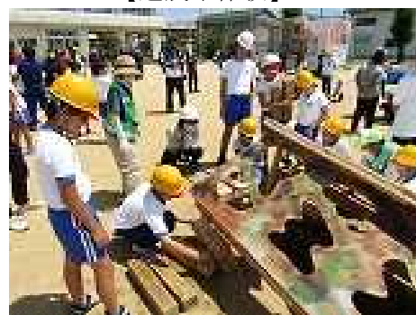
【倒壊家屋救出訓練】