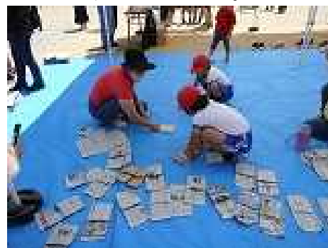
【防災スリッパ作り】