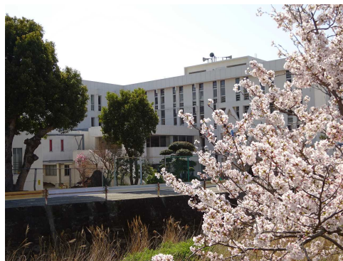
桜と校舎と 青空と