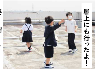
屋上にも行ったよ！

素敵な先輩2年生は、お掃除もとても上手です。毎日、職員玄関や2階ホールをピカピカに磨きあげてくれます。「傘立てを動かして掃除しよう」と提案し、たまったほこりも雑巾で一拭き！美しい学校づくりに協力してくれています。ありがとう、2年生。（*屋上は普段は施錠しております）