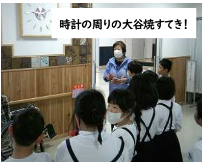
時計の周りの大谷焼すてき！

「町たんけん」に繰り出したのは3年生です。東コース、西コース、北コースと3つのコースの探検に出かけました。北コースでは、公民館の見学をさせていただきました。館長さんから、時計の周りの壁が大谷焼で飾られていることをお聞きしたり、公民館を建てる時に発見された遺跡の出土品を見せていただいたりして、地域の施設について学ぶよい機会となりました。