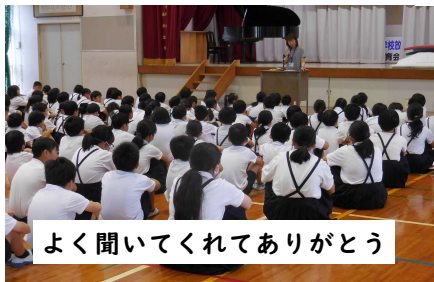
よく聞いてくれてありがとう

今年度に入って、体育館に集合して朝会や集会を行うことが増えました。3年間、このような活動が少なかったのですが、初めは礼をすること、しっかり話を聞くことが十分ではなかったのですが、今では、前に誰かが立つと、体と視線を向けてしっかりと聞けるようになりました。よいお手本を示してくれるのは上学年の子どもたちです。みんなの視線が集まると、本当にうれしいです。「聞く力」は全ての学習の基本です。堀江北小学校に聞き方名人が増えていること、自慢です！