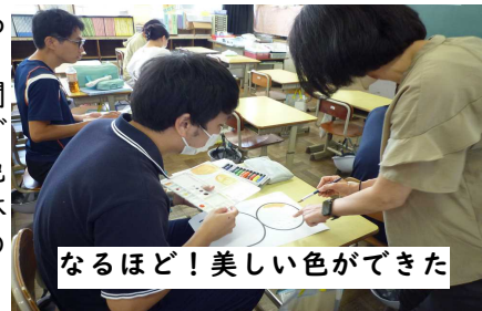
なるほど！美しい色ができた