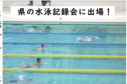
県の水泳記録会に出場！

7月24日(月)に、鳴門市第一中学校で市の水泳記録会が開催されました。6年生3名の児童が出場しました。開会行事で、「水泳には、自分の記録と向き合い、更新していく楽しさがある」というお話を聞き、その通りだと感じました。記録会に向けて練習を重ね、自分と向き合ってきた全ての学校の児童が、素晴らしい泳ぎを見せてくれました。予想外の雨天でしたが、本校3名の児童も一杯泳ぎました。お疲れ様でした。