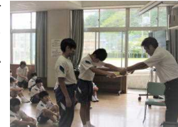
ロードアドプト 表彰

夏休みに入る前に、子どもたちには、「夏休み期間中続けることを決めて、実行してください。」と話しました。9月1日（金）の休み明け集会でどんなことを続けていたか聞いてみると、「お手伝いを続けて行った。」「学習や自由研究をがんばった。」という答えがかえってきました。たいへんすばらしいことだと思いました。続けることはたいへんです。時にはあきらめてしまいます。でも1日がんばると3日、3日がんばると7日、7日がんばると15日。と積み上げていくと、自分の目標を達成することができます。また、続けていくということが力となっていきます。そのことが自信となり、いろいろなことを続けていくこともできます。この夏休み期間中続けることができた人は、9月からもしっかりと続けてください。また、できなかった人も何か自分で目標をもって続けてください。続けていくと知らぬ間に自分に力がついています。