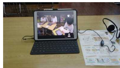
配信した授業の様子