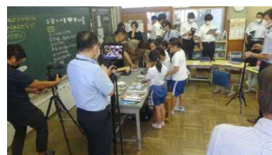
授業の様子を配信中