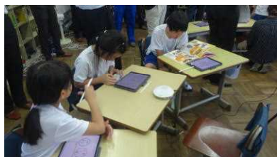
模型や教科書を使って考え中