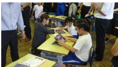
タブレットを文房具として