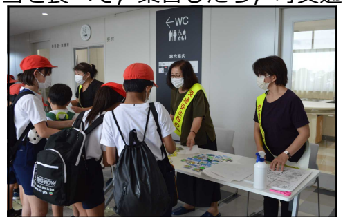
交通安全母の会のみなさん

ます。田んぼの中の道を通って鳴池線の高架下にある「歌の国」で、みんなで歌を歌いました。北進し金泉寺では「理科の国」ということで、動物か植物の名前をたくさん書くというゲームを、最後の亀山神社では、「国語の国」で、全員であいうえお表を完成させて、学校でゴールとなります。