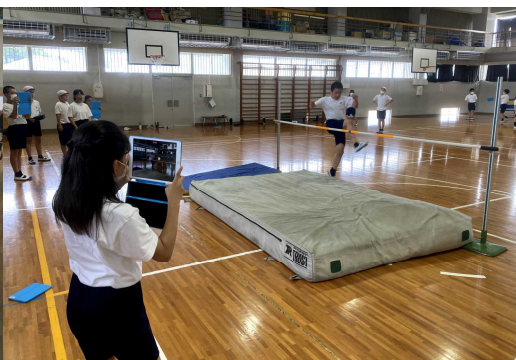
6年生 走り高跳びのフォームをカメラで撮って確かめ合っています。