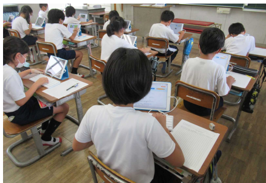
3年生 キーボードをつないで調べ学習をしています。

先月には、お子さんが一度ご家庭へiPadを持ち帰ったことと思います。今後、時には宿題としてドリル学習や調べ学習に取り組んでもらうために、児童が自宅へ持ち帰って学習する機会もあることと思います。すでに、学校内では、子どもたちがiPadを持って学習する姿がよく見られるようになりました。いくつかご紹介します。