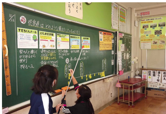
4年生の授業 発表の様子

その研究授業が 11月8日(月) と 11月10日(水) に行われることになり、8日には5・6年生、10日には3・4年生が研究授業をすることになっています。研究授業をしない学年・学級のお子さんは、下校時間がいつもと変わりますが、よろしく願います。