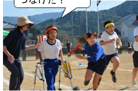
うまくバトンを つなげた！