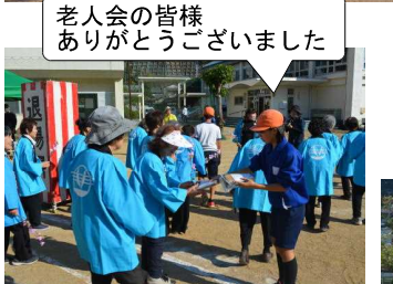
老人会の皆様 ありがとうございました