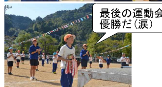
最後の運動会 優勝だ(涙)