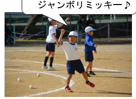
ジャンポリミッキー ジャンポリミッキー