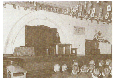
創立80周年記念式典