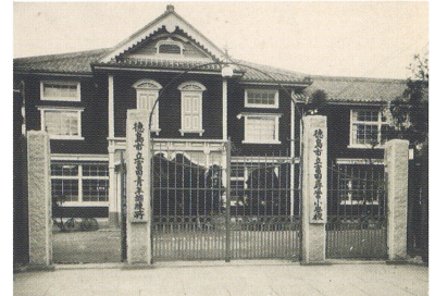
徳島市立富田尋常小学校