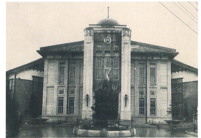
徳島市富田尋常小学校