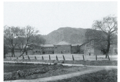
創立50周年頃の校舎全景