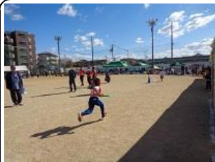
昭和・山城地区 秋の大運動会

10月29日（日）昭和小学校の運動場で、昭和・山城地区秋の大運動会が開催されました。子どもたちは、徒競走や地区対抗リレー等の競技に参加しました。また、プラスバンド部の演奏やスポーツ少年団の行進も行われました。地域の皆様方とふれ合えるよい機会となりました。