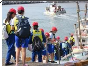
牟岐少年自然の家宿泊学習

10月23日（月）・24日（火）5年生が牟岐少年自然の家宿泊学習に行ってきました。1日目はグリーンアドベンチャーやキャンドルのつどい、2日目は大島・出羽島めぐり等の活動を行いました。牟岐の自然を満喫した有意義な宿泊学習になりました。