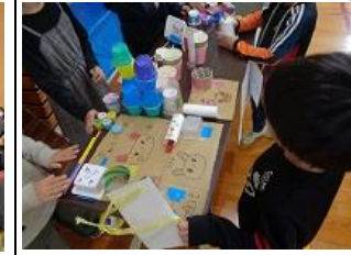
生活科 おもちゃランド

10月30日（月）なかよし集会が行われました。図書委員会や学校もりあげよう委員会からの〇×クイズで、大変盛り上がりしました。