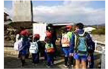
ここの課題は何か？