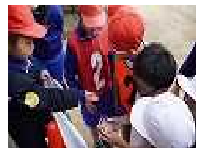
宝箱を見つけたよ。