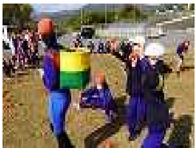
追いかけて玉入れ！