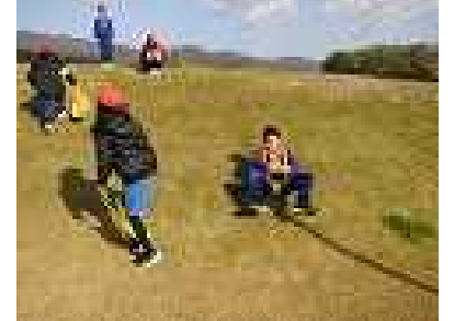
そり滑りは全員クリア！