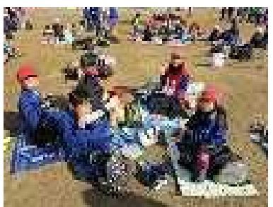
班で仲良く昼食タイムです。