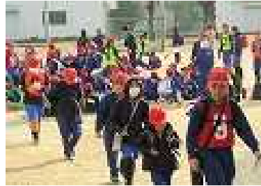
まっすぐ並んで安全に！