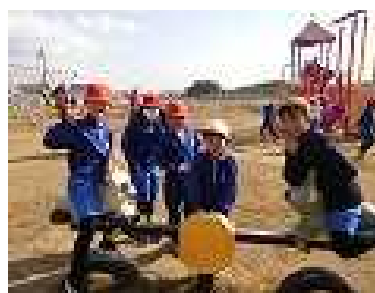
ふれあい班で楽しく遊んだよ！