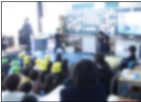
昔遊びのコマ回しを披露