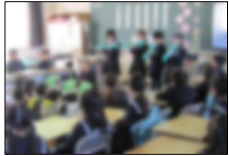
「きらきらぼし」の演奏