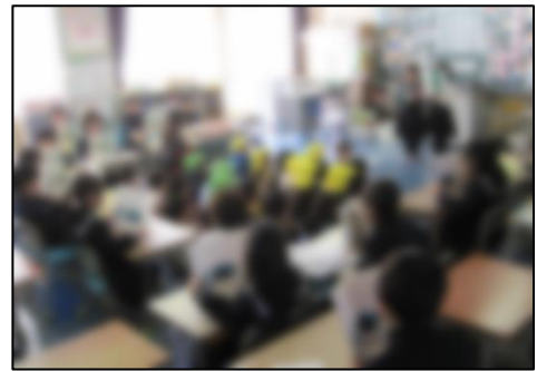
国語の音読を全員で