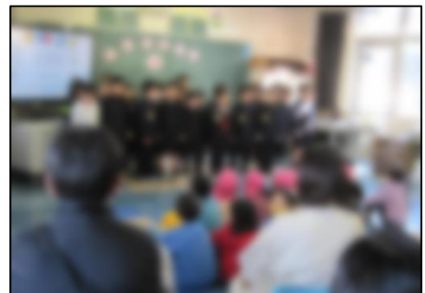
みんなで楽しそうに歌う1年生

2月14日(水)に、1年生の見学会がありました。地域の幼稚園・保育所の子どもたちを1年生の教室にお招きし、小学校で学習する内容を発表会形式で紹介しました。国語で学習する音読、音楽で学習する「きらきらぼし」の演奏や歌、生活科で学習する昔遊びの紹介など、分かりやすく紹介することができました。最初、緊張ぎみだった幼稚園・保育所の子どもたちも1年生のお兄さんやお姉さんの発表を聴いて、川内北小学校に入学することが更に楽しみになったことと思います。