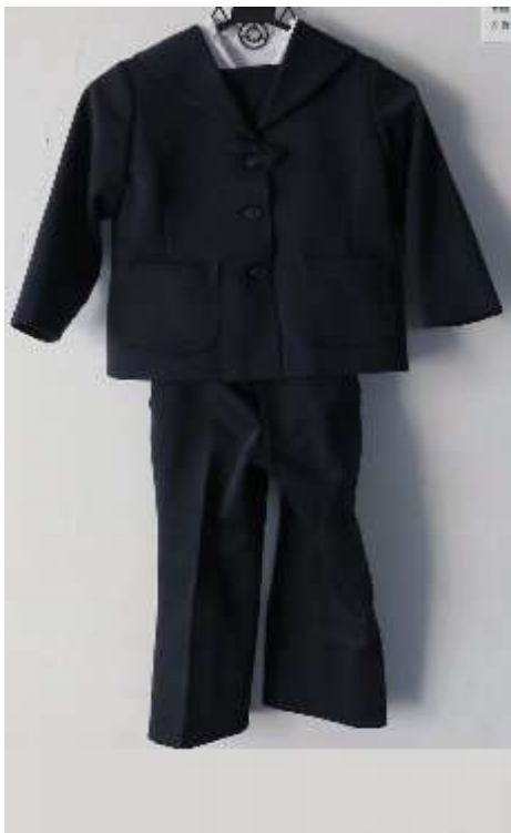
【標準服取り合わせ 3】