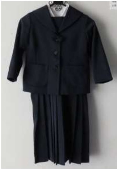
【標準服取り合わせ 1】