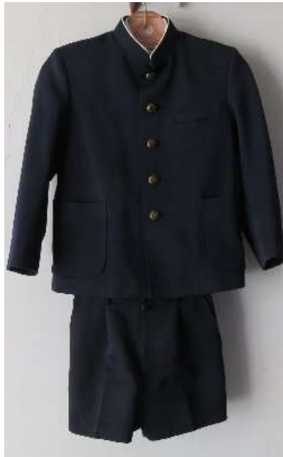
【標準服取り合わせ 2】