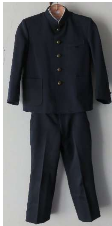
【標準服取り合わせ 4】