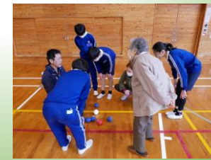
白球に近いのはどちらのチーム？