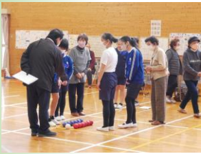
最初にルール確認です。

2月27日(火)の5・6校時、橋住民センターや社会福祉協議会の皆さんのお世話で、橋町の高齢者の方と5・6年生の子どもたちによる、ポッチャの交流会を行いました。子どもたちと高齢者の方で混合チームを作り、試合を楽しみましたが、最初に投げた白いジャックボールに近いところに球を投げるナイスプレーの連続で、試合は大変盛り上がりしました。