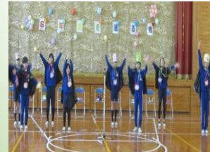
6年生のキレキレダンス