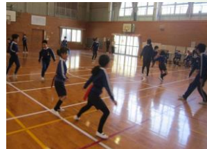
3年生としっぽ取りゲーム