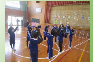
アーチを作って6年生を見送り