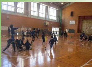
1年生と新聞ポイポイゲーム

3月1日(金)、5年生の企画・運営で「6年生を送る会」を実施しました。1年生から5年生までの児童が6年生と様々なゲームを一緒に楽しみ、手作りのプレゼントやメッセージカードを6年生に手渡しました。6年生は、お礼として「キレ」のあるダンスを披露してくれました。最後まで明るい6年生です。6年生と一緒に過ごすことができるのもあと9日。一人一人が6年生と楽しい思い出をつくってほしいと思います。また、会の計画・準備・進行をがんばった5年生。6年生は、安心して皆さんにあとを任せられると思ったことと思います。お疲れさまでした。