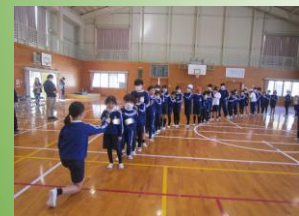
全校児童でじゃんけん列車