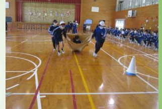
4年生と魔法のじゅうたんゲーム