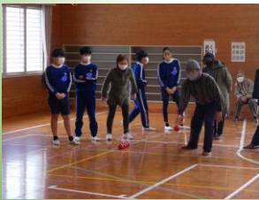
高齢者の方をしっかりと応援します。