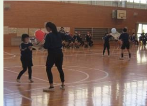
2年生と風船リレー