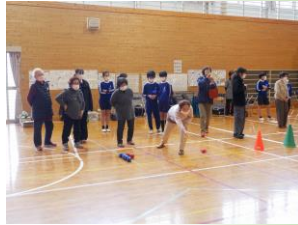
白い球をねらって投げます。