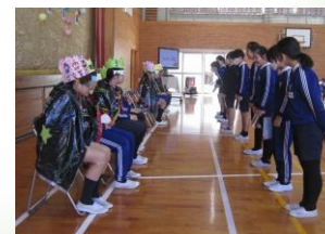
5年生からプレゼント