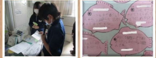
阿南市立宝田小学校