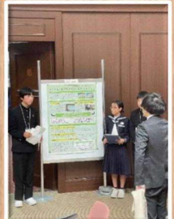
阿南市立羽ノ浦中学校

「いじめ防止子ども委員会」は県内全ての公立小・中学校、中等教育学校、特別支援学校小・中学部に設置