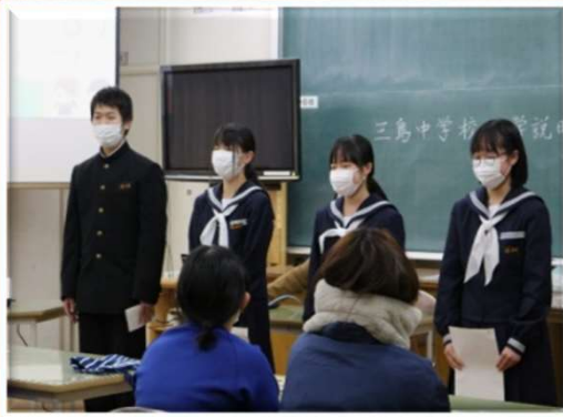
美馬市立三島中学校