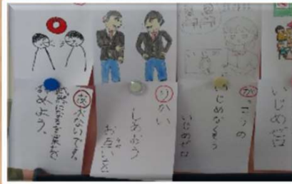
徳島県立徳島聴覚支援学校