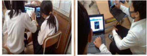
藍住町立藍住西小学校