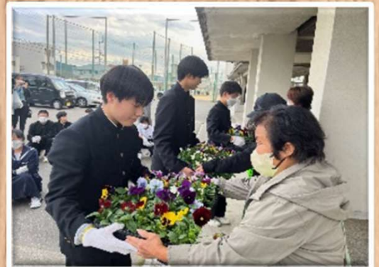
徳島市津田中学校