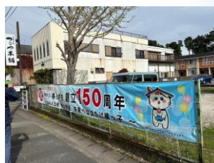
スカイブルーの素敵な横断幕。