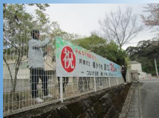
桜坂フェンスに教職員で設置。

ぜひ多くの方に見ていただき、一緒に創立150周年を祝ったり記念行事を楽しんだりしていただけたらと願っています。