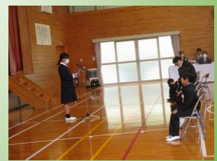
児童代表挨拶 6年生広〇さん