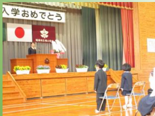
入学児童呼名・入学許可宣言

何もかも初めての1年生にとっては戸惑うことばかりであったと思いますが、「おめでとう」の言葉に「ありがとうございます」と元気に反応を示すなど、一生懸命な姿を見せてくれました。これから一日、一日、新しいことをどんどん学んで、健やかに成長してほしいと願います。