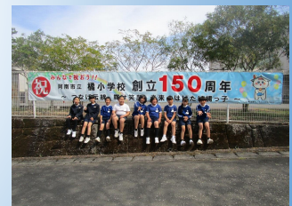
5年生が記念写真をパチリ。