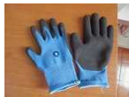
ゴム手袋 ← こんな感じです