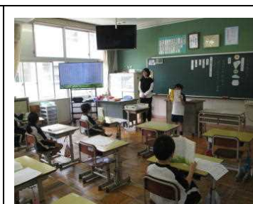
2年【国語】「ふきのとう」