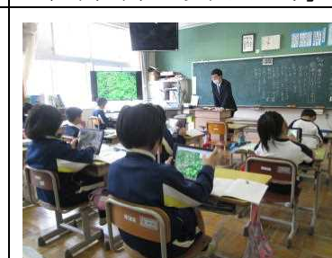
3年【国語】 「きせつの言葉 春のくらし」