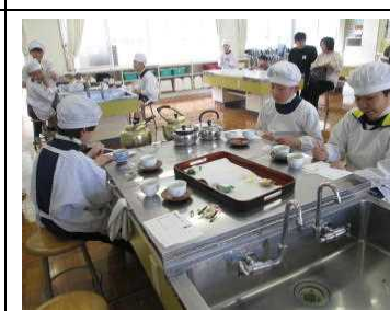
5年【家庭】 「お茶を入れてみよう」