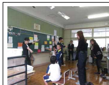
わくわくすくすく【自立活動】 「わくすくすくごろうをしよう」

4月20日(土) 今年度、初めての授業参観がありました。新しい教室で一生涯懸命に学習に取り組む子どもたちの姿を、多数の保護者の皆様に参観していただきました。PTA総会、学年懇談会への参加・協力もありがとうございました。