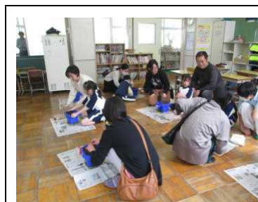
1年【生活】「たねをまこう」