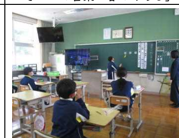
6年【国語】 「漢字の形と音・意味」