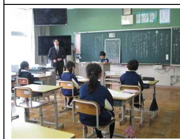
4年【国語】「春の楽しみ」