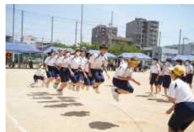
跳んで徳中～徳中より愛をこめて(長縄) 1位4組, 2位5組, 3位1組