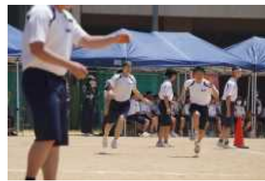
思いを込めて つなげバトン(チキチキマシーン猛レース) 1位5組, 2位2組, 3位4組