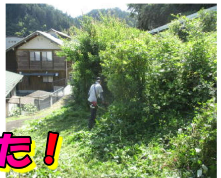
奉仕作業お世話になりました！