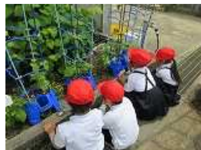
観察をしている様子

あさがおの観察や水やりを生活科でしています。「何色の花が咲くかな。」「いつごろ花がさくかな。」「はやく大きくなってね。」と、あさがおに話しかけたり、「ミミズがいたらいいんだって！」「くさがあると大きくなならないかもしれないから抜かないとね。」と、友だちと話しながら観察をしたりしています。 21日には、支柱を立てました。つるが出て小さなつぼみを見つけた子ども達は、花が咲くことを楽しみにしています。