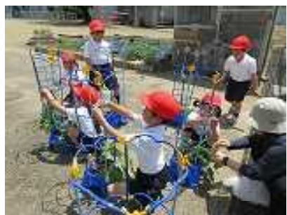
5月21日に支柱を立てました