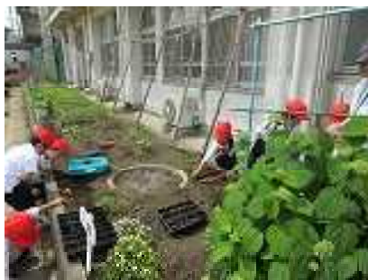
草抜きをしている様子