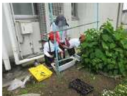
間引いて植え替えをしている様子