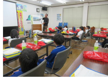
バンドウリメイク