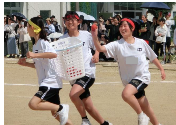
2年生「玉入れ鬼ごっこ」