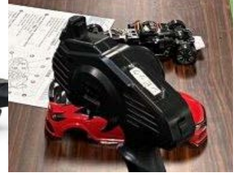
①自動運転プログラミング ②ソーラーカー工作 ③ミニ四駆工作 ④バーチャル&リアル体験