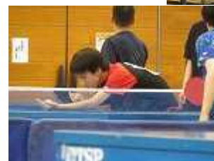
この一球に全て をかける