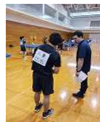
顧問の先生の助言 を次に生かす!