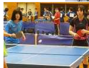
このペアでの試 合も最後...