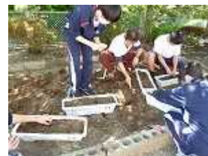
1粒1粒 丁寧に種まき

6月17日(月)壮行会がありました。「ドライブの練習を中心にしてきたので出し切る。」「2回以上勝ちたい。3年生に教えてもらったことを発揮する。」など、1人1人決意を發表しました。22日(土)団体戦、23日(日)個人戦でした。3年生は県大会への出場をかけた順位決定戦まで進むことができました。あと1枠で県という悔しく残念な結果もありました。最後まで精一杯の力を出し切って頑張っている姿を見て、心から椿町中生のことを誇らしいと思いました。生徒の皆さんが、相手と向き合い、自分の心をコントロールし、チャレンジしたからこそ見える景色、最後まであきらめずにやり遂げたからこそ出会えた感動です。