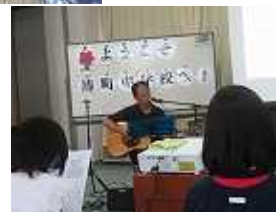
講師先生の言葉が 人としての成長に つながります